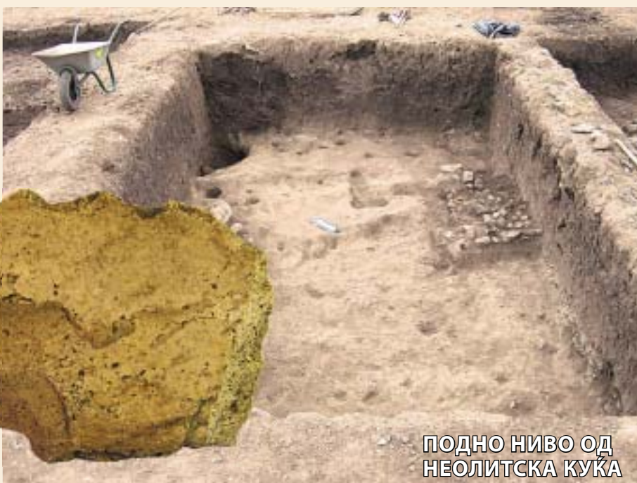
ПОДНО НИВО ОД НЕОЛИТСКА КУКА