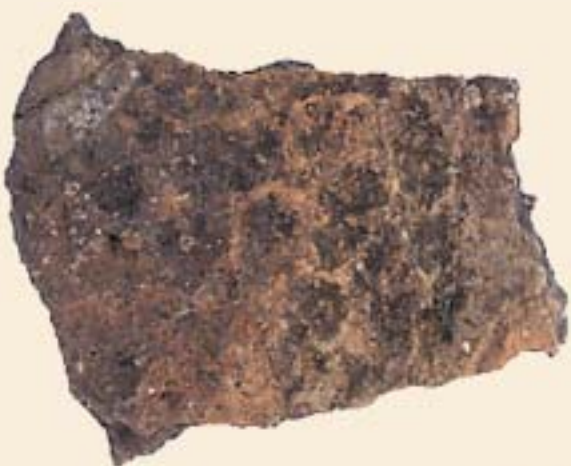
АЛАТКИ ОД КРЕМЕН

Според досегашните, првични сознанија, населбата е подигната на карпеста подлога, а куќите биле градени со колци од кои се откриени лежишта во карпата и во плитарот. Со натамошните археолошки ископувања археолозите се надеваат дека ќе бидат откриени уште многу наоди, кои ќе придонесат за поблиско хронолошко определување на населбата.